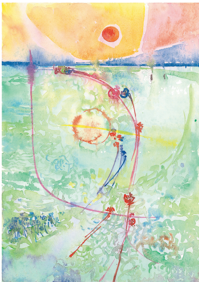
Riflessi n. 21 , 1984, acquerello su carta, cm 34x24

Dopo la sua morte a Torino nel 1995 è stata ricordata con numerose esposizioni delle sue opere e in particolare con l'ampia retrospettiva "Anima Mundi" del 2006-'07 presso la Società Promotrice delle Belle arti in Torino.